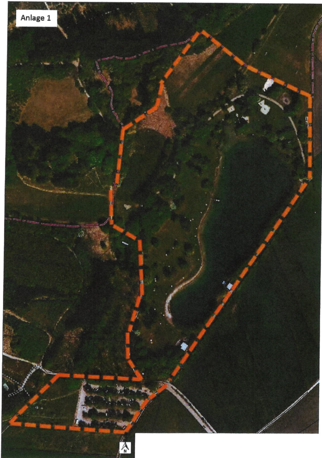
Umgriff „Erholungsgebiet am Parsberg“